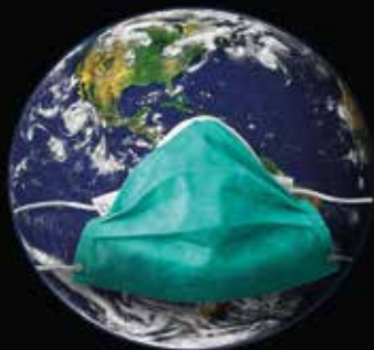
Et halvt år med corona