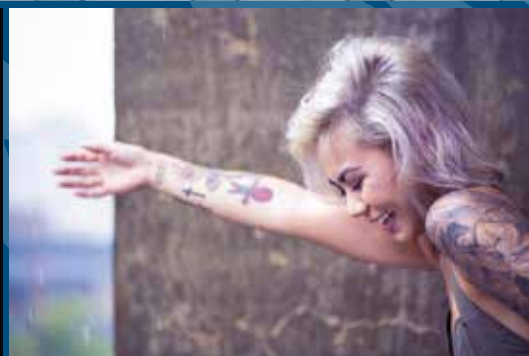
Stort behov for akutboliger til unge