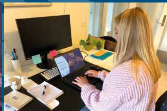
Ny ungerådgivning i Odense og Aarhus