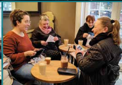
Projekt Hjerterum på Kontaktcentret bekæmper ensomhed