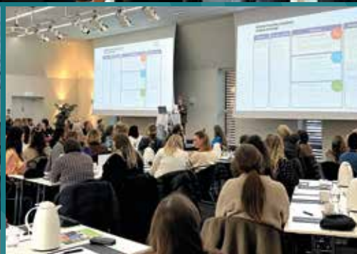
KFUKs Sociale Arbejdes nye strategi præsenteret