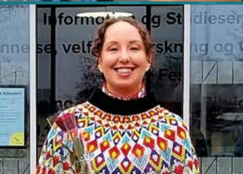
Styrket indsats for grønlandske kvinder i Rederne